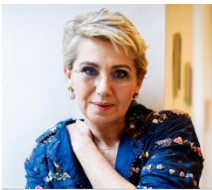
Concita De Gregorio - Consigliera

Già Vicepresidente della Commissione Igiene e Sanità del Senato , è stata rieletta Consigliera di Europa Donna Italia, dove è anche Delegata per l'Emilia-Romagna. Ha un'esperienza consolidata nell'ambito istituzionale e sanitario. Intende proseguire il proprio impegno nell'advocacy per i diritti delle donne, mettendo a disposizione la conoscenza del sistema sanitario a livello nazionale e regionale.